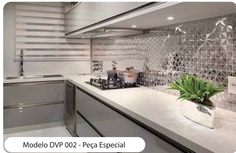
Modelo DVP 002 - Peça Especial

*Peças especiais metálicas: DVP 002/003/004